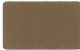
スチールアンバー 31