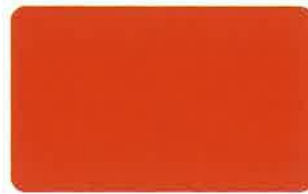
エルコラーノレッド 23