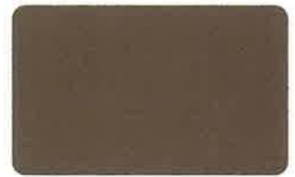
グリーンアンバー 32