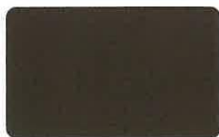
ローマンブラック 41