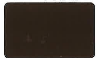
カッセルブラウン 40