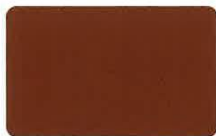
バントアンバー・ショコラ 38